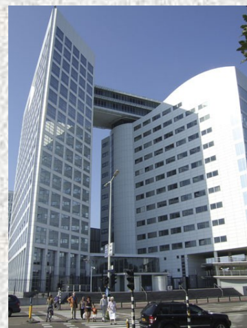
Sediul CPI, Haga, Olanda

Conform rezoluției adoptată în cadrul conferinței de revizuire a Statutului CPI, care a avut loc în Kampala, Uganda, la începutul lunii iunie, blocadele asupra porturilor sau coastelor unui stat de către forțele armate ale altui stat, precum și o invazie sau un atac efectuat de către trupele unui stat pe teritoriul unui alt stat sunt considerate acte de agresiune în conformitate cu Statutul.